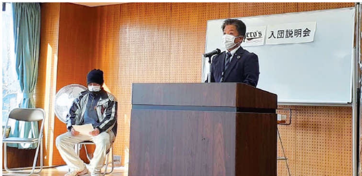
安城ヒーローズ入団説明会 冒頭挨拶