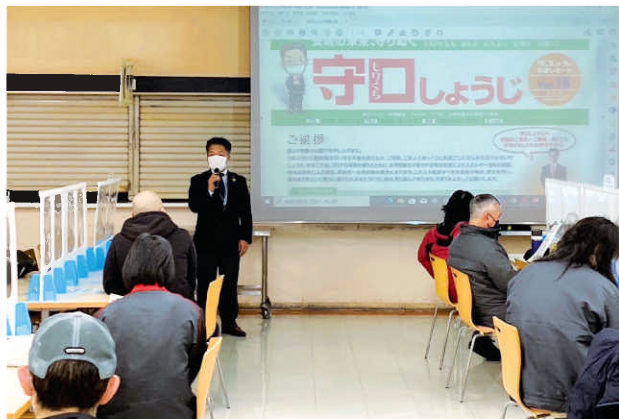
地域生活懇談会市政報告(安城第1)