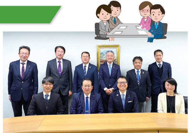
浜口誠参議院議員との意見交換会