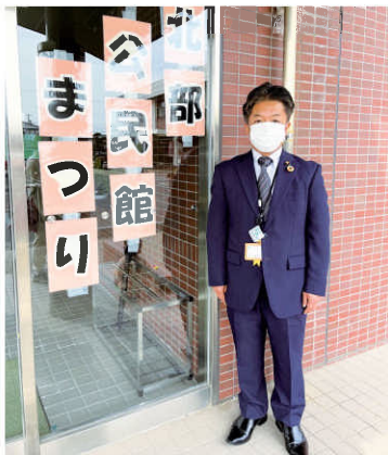
北部公民館まつり見学