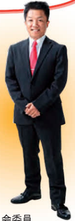
安城市議会議員 ・総務企画常任委員会委員 ・未来型施設整備研究特別委員会委員