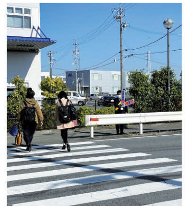
交通安全立哨 新三商事(株)