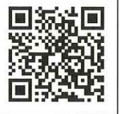
安城プレミアムお買物券HP