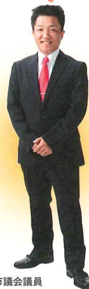
安城市議会議員 産業建設常任委員会委員 議会 ICT 推進プロジェクト委員副座長 未来型施設整備研究特別委員会委員